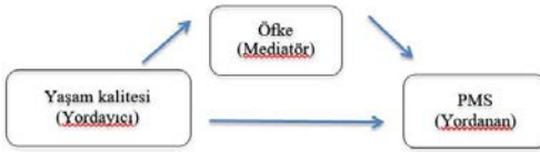
Şekil 2. Model 2- Yaşam kalitesi ve PMS arasındaki ilişkide öfke düzeyinin mediatör etkisi

* p < .01 . B: unstandardised regression coefficient. \beta : standardised regression coefficient. p: p value. F: F statistic. R 2 : R Squared. \Delta R^2 : Delta R Squared