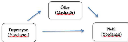
Şekil 3. Model 3- Depresyon ve PMS arasındaki ilişkide öfke düzeyinin mediatör etkisi

* p<.01 . B: unstandardised regression coefficient. \beta : standardised regression coefficient. p: p value. F: F statistic. R 2 : R Squared. \Delta R^2 : Delta R Squared